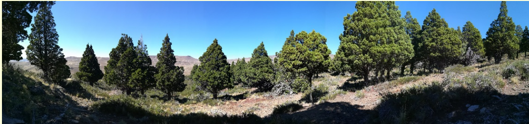
Muestra de madera

Tema de la beca: Análisis de datos (series temporales) de crecimiento y caracteres de la madera de distintas especies arbóreas.